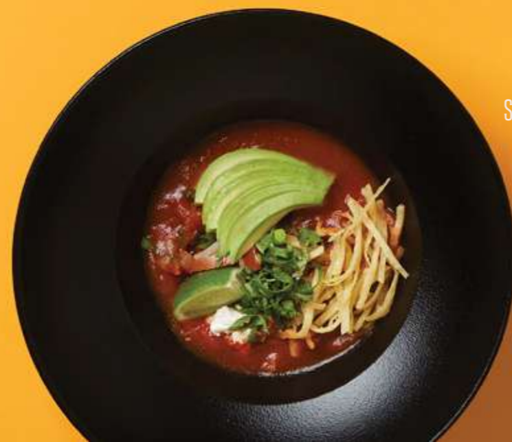
SOPA AZTECA CON VERDURAS