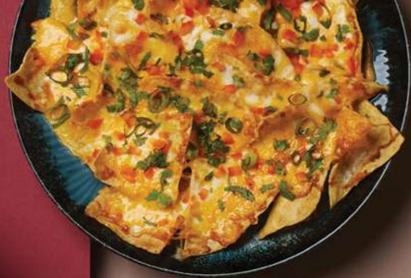
NACHOS ZAPEČENÉ SO SYROM