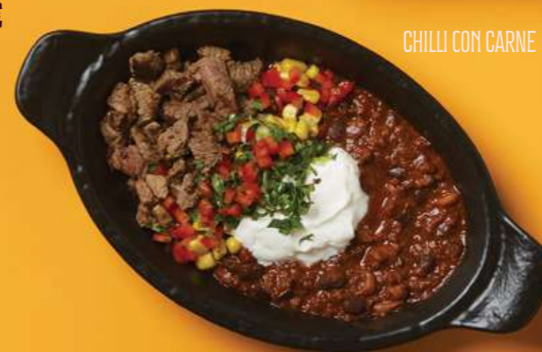
CHILLI CON CARNE