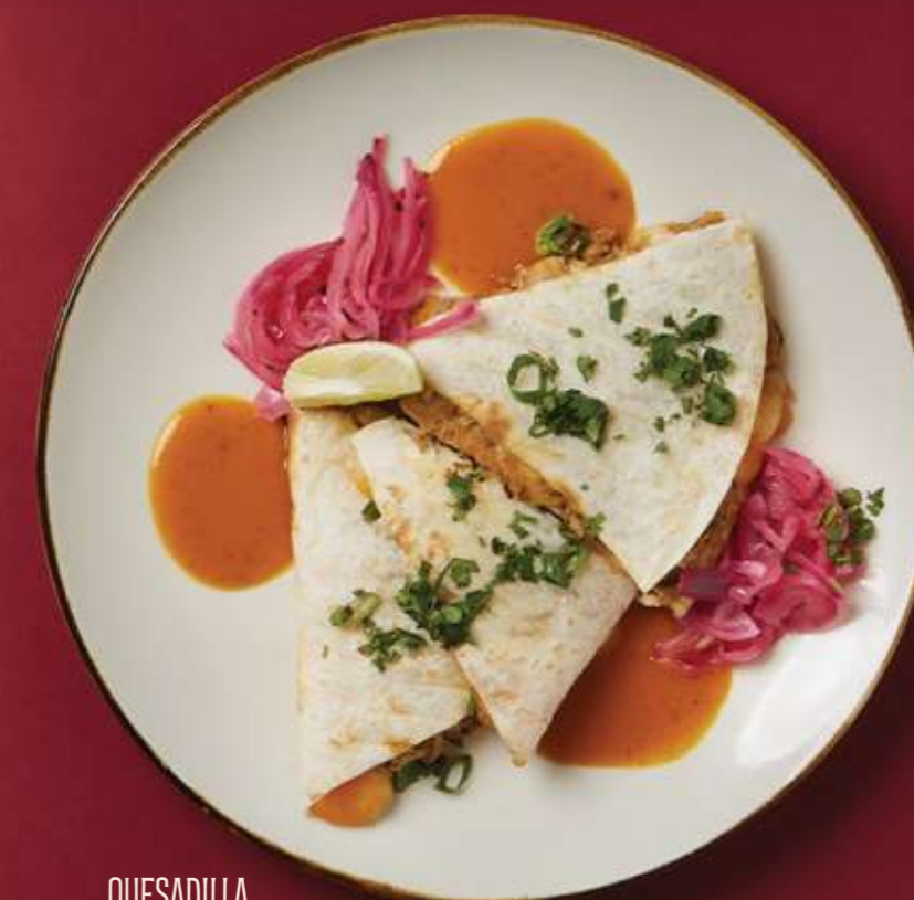
QUESADILLA COCHINITA PIBIL