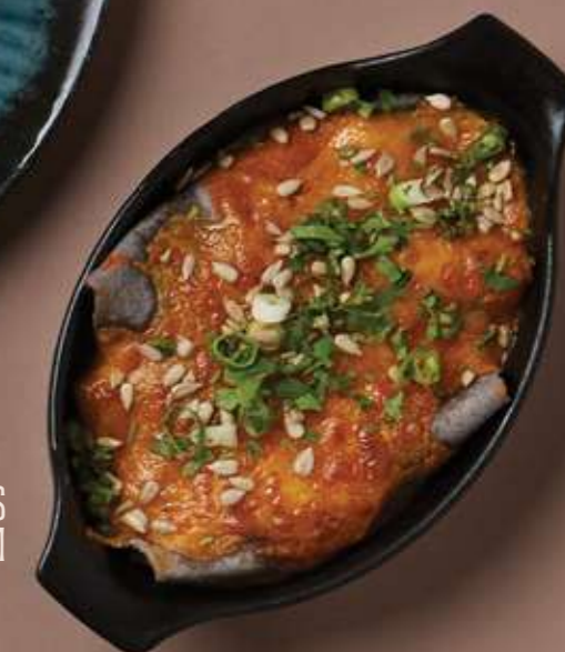
ENCHILADAS S KURACÍM MÄSOM