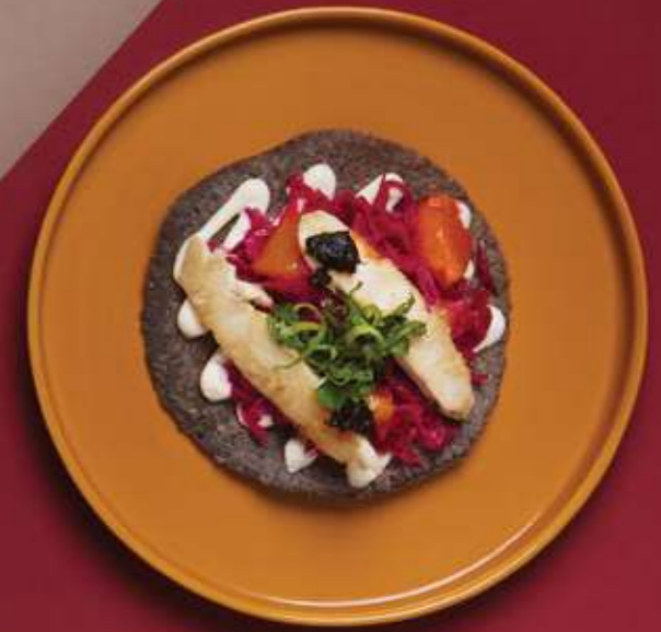
TACOS POLLO MANI