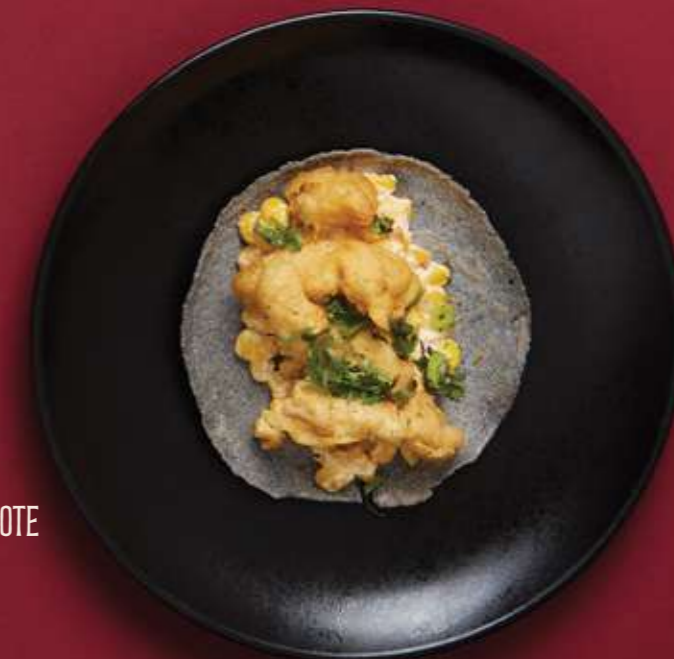
TACOS DE ELOTE