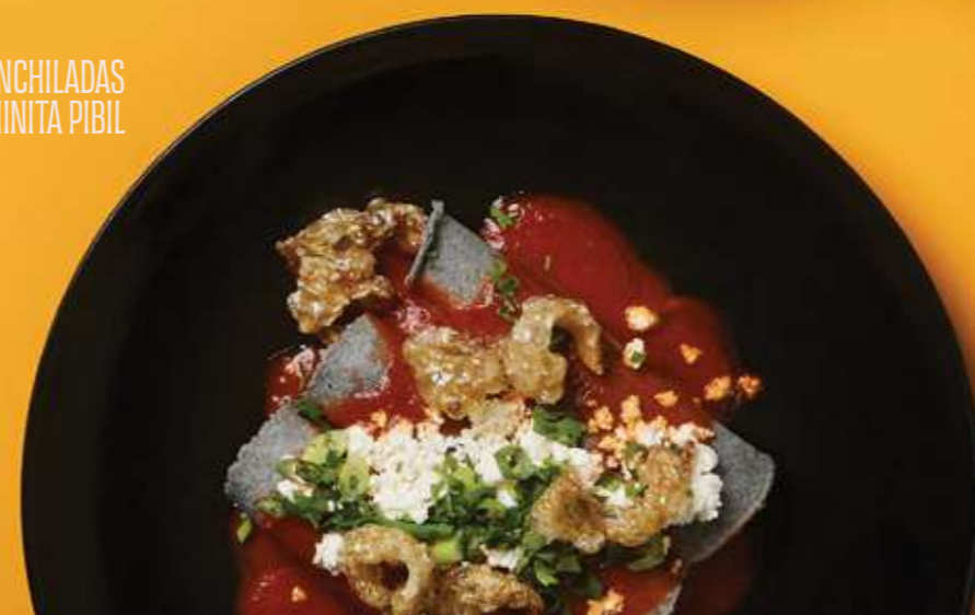
ENCHILADAS COCHINITA PIBIL