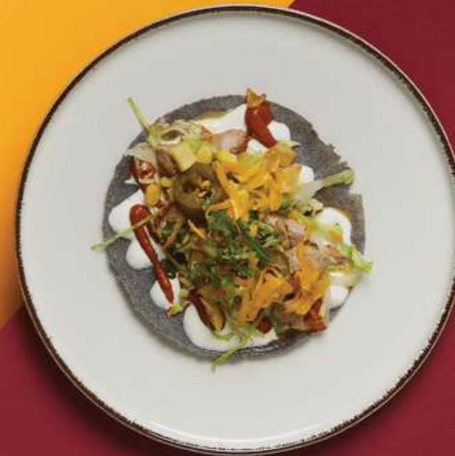
TACOS CERDO ASADO