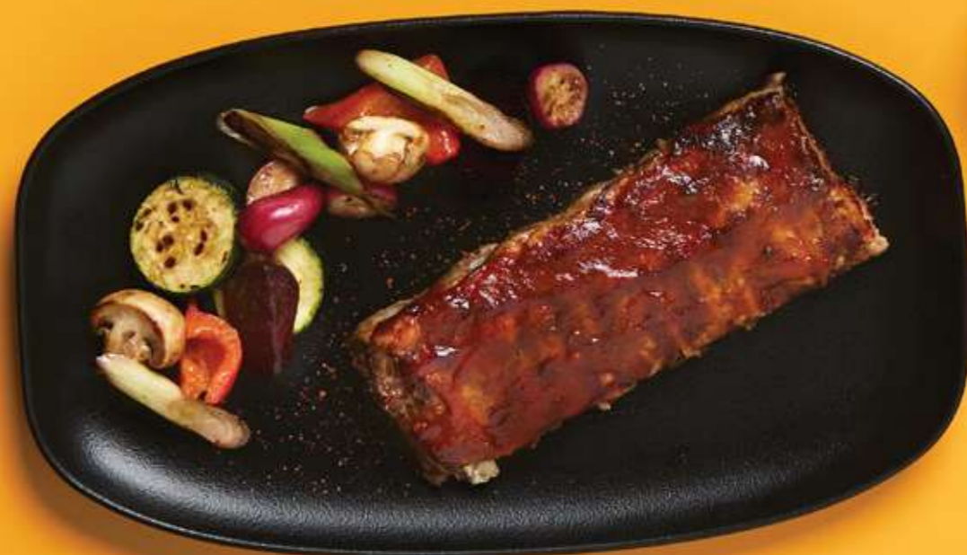
REBRÁ ADOBO BBQ

PEČENÁ ZELENINA, FETA, SALSA VERDE, BRAVAS SALSA 7,9 € 300 G