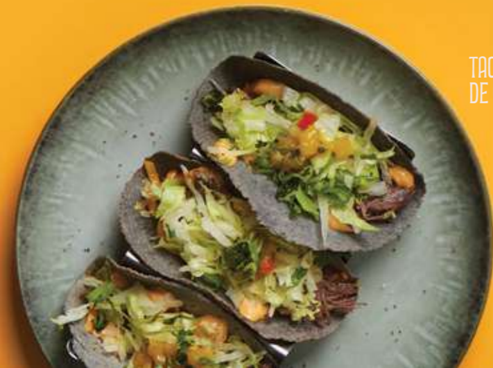
TACOS DE CARNE