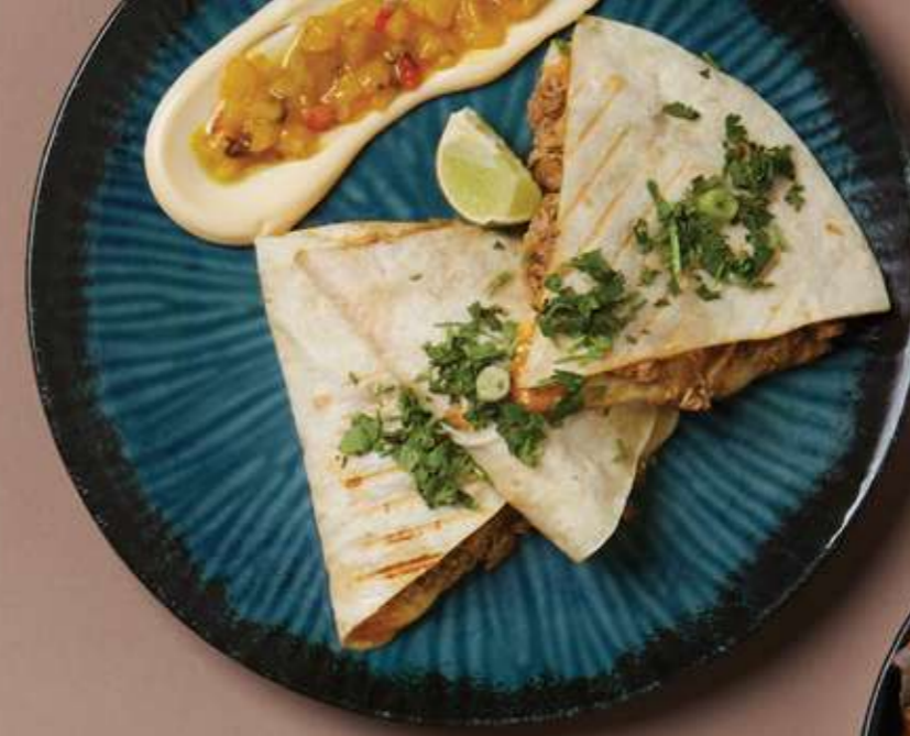
QUESADILLA CON POLLO

S pečenou zeleninou, syrom, cícerom, queso con tajín, salsou verde a fetou